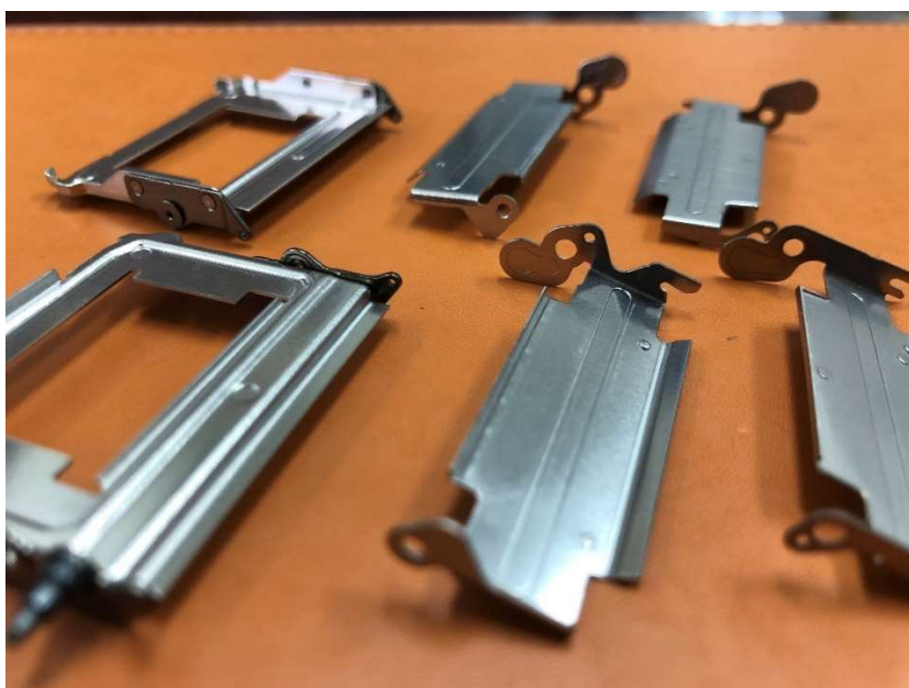
純チタン（JIS 1 種相当） t=0.3\sim t=0.4 平面度 0.03 平行度 0.05