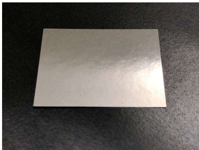
純チタン（JIS 1 種相当） t=0.04 バリ無し加工